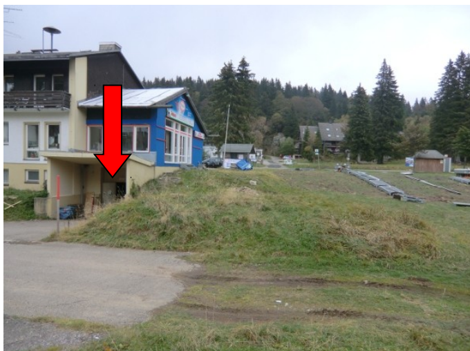
Bild B: Depotraum des LZ Herzogen Horn (für Notfälle bei sehr früher Anreise)

Wer früher ankommt und einen Parkplatz ergattert hat kann sein Gepäck in der Garage des LZ (s. Bild B) unterstellen und sich bei einer Tasse Kaffee mit Kuchen im Café Wasmer (s. Bild C) warm halten. Dort ist der übliche Treffpunkt der „Frühanreiser“.