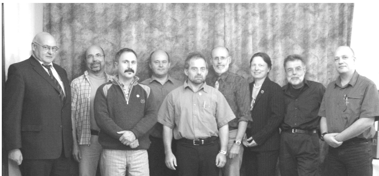
Das DAB-Präsidium in neuer Zusammensetzung

Als besonders maßgeblich in der Auswirkung möchte ich Änderungen im Bereich